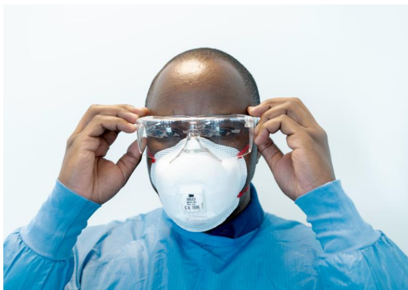
Rycina 12. Zakładanie gogli ochronnych z zausznikami

W przypadku okularów/gogli ochronnych z zausznikami, należy się upewnić, że zostały one prawidłowo założone i są w odpowiednim rozmiarze (Rycina 12).