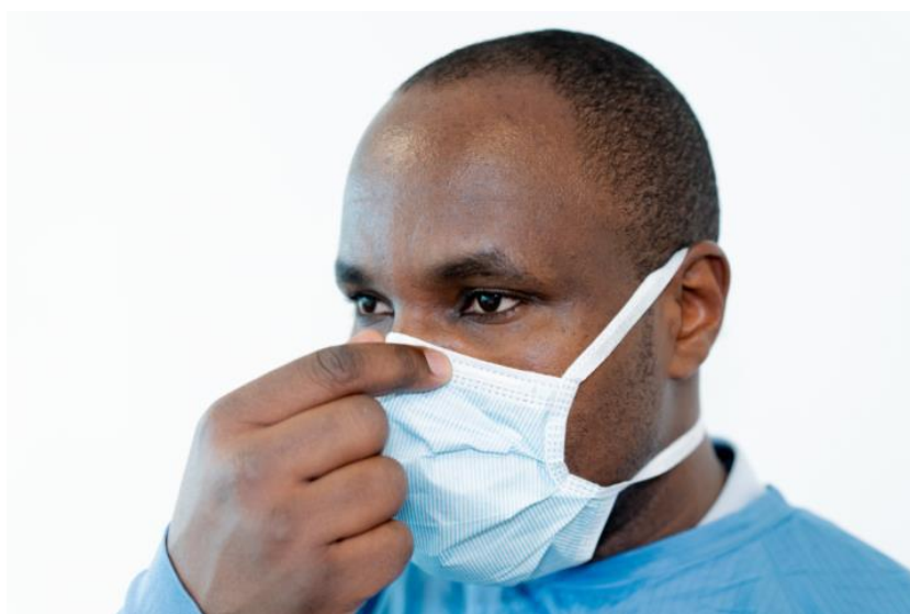
Rycina 9. Dopasowywanie maseczki chirurgicznej za pomocą wbudowanej metalowej listewki.

Po założeniu i dopasowaniu półmaski/maseczki należy założyć okulary/gogle ochronne lub przyłbice. Należy założyć je na paski półmaski/maseczki i upewnić się, że jest ona stabilnie i komfortowo zamocowana (Ryciny 10 i 11).