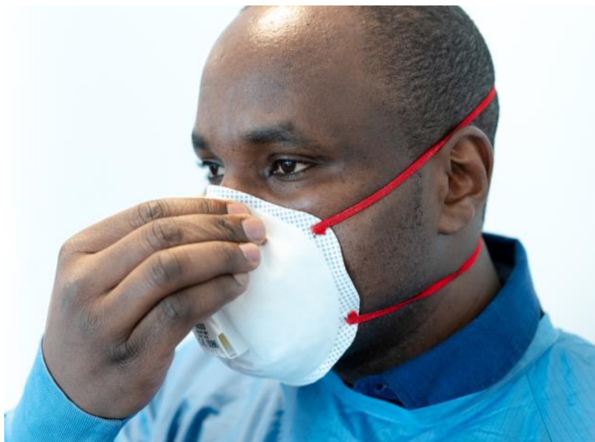
Rycina 7. Dopasowywanie metalowej listwy do kształtu twarzy.

Należy dopasować metalową listwę tak by półmaska ściśle przylegała do nosa oraz zaciągnąć paski tak by uzyskać stabilne i komfortowe dopasowanie półmasks. Jeżeli pojawiają się problem z odpowiednim dopasowaniem maseczki można spróbować skrzyżowania pasków (choć może być to sprzeczne z zaleceniami producenta).