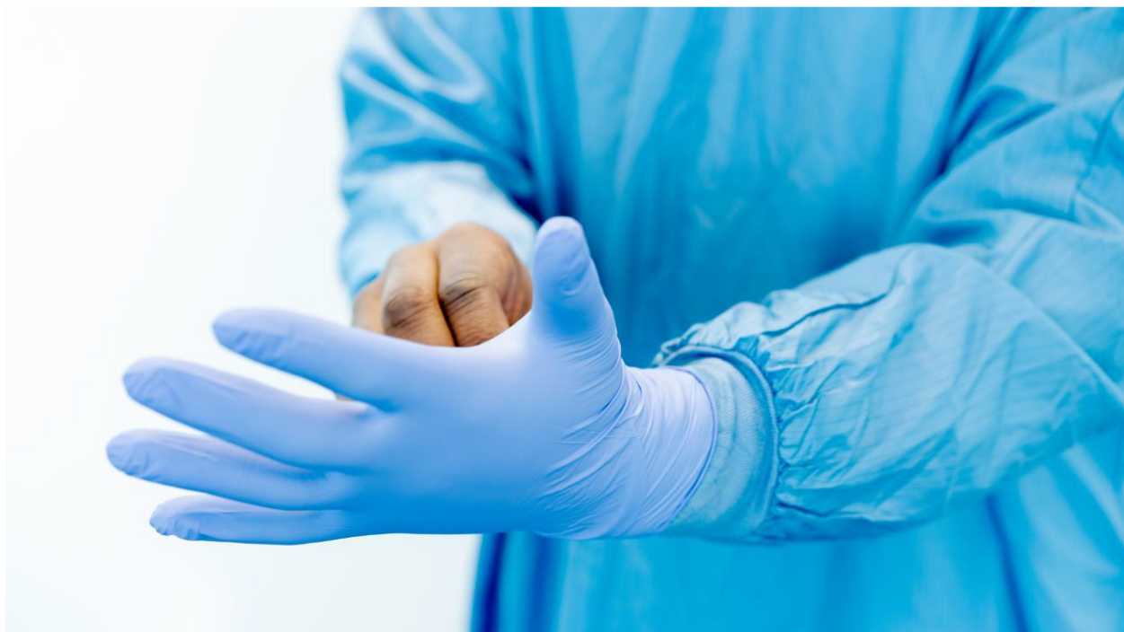
Rycina 13. Zakładanie rękawiczek.

Po założeniu ochrony na oczy należy założyć rękawiczki. Przy zakładaniu rękawiczek należy pamiętać, że powinny one nachodzić na rękaw fartucha (Rycina 13). Dla osób uczulonych na lateks należy udostępnić rękawiczki z innego materiału (np. winylowe lub nitylowe).