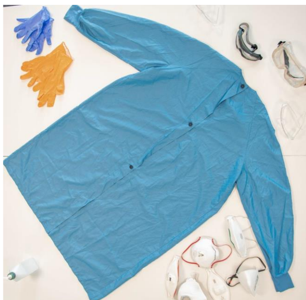
Rycina 1. Sugerowane ŚOI do użytku przez personel zajmujący się pacjentami z podejrzeniem lub potwierdzonym zakażeniem SARS-CoV-2 (COVID-19): półmaski FFP2 i FFP3, gogle/okulary ochronne, wodoodporny fartuch z długim rękawem.

https://www.ecdc.europa.eu/sites/default/files/documents/novel-coronavirus-personal-protective-equipment-needs-healthcare-settings.pdf [6].