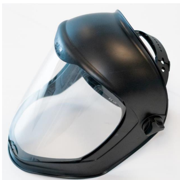
Rycina 2. Przyłbica

Większość ŚOI dostępna jest w różnych rozmiarach. Ważnym jest by pamiętać, że odpowiednie dopasowanie ŚOI do użytkownika jest konieczne do uzyskania pełnej ochrony. Nieodpowiednio dopasowane ŚOI nie zapewniają pełnej ochrony użytkownika.