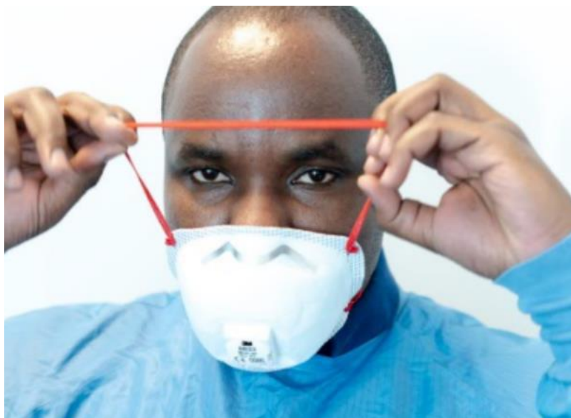
Rycina 6. Zakładanie półmasks FFP2/FFP3.

https://www.ecdc.europa.eu/sites/default/files/media/en/publications/Publications/safe-use-of-ppe.pdf [5].