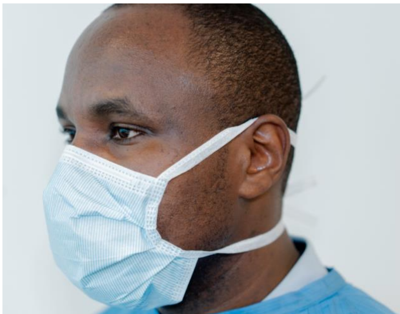
Rycina 8. Zakładanie maseczki chirurgicznej