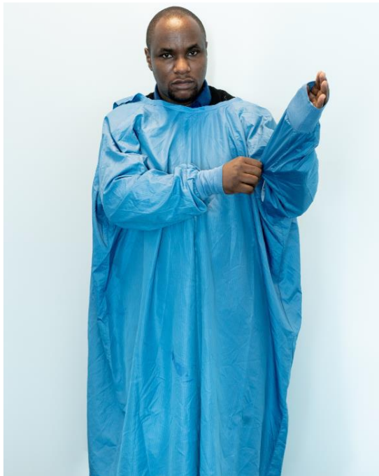
Rycina 4. Zakładanie wodoodpornego fartucha z długim rękawem.

Zakładanie ŚOI należy rozpocząć od fartucha (Rycina 4). Istnieją różne typy fartuchów (jedno- i wielorazowe). Poniższe instrukcje dotyczą stosowania fartucha wielorazowego użytku z długim rękawem. W przypadku fartucha zapinanego/wiązanego z tyłu należy skorzystać z asysty osoby trzeciej (Rycina 5).