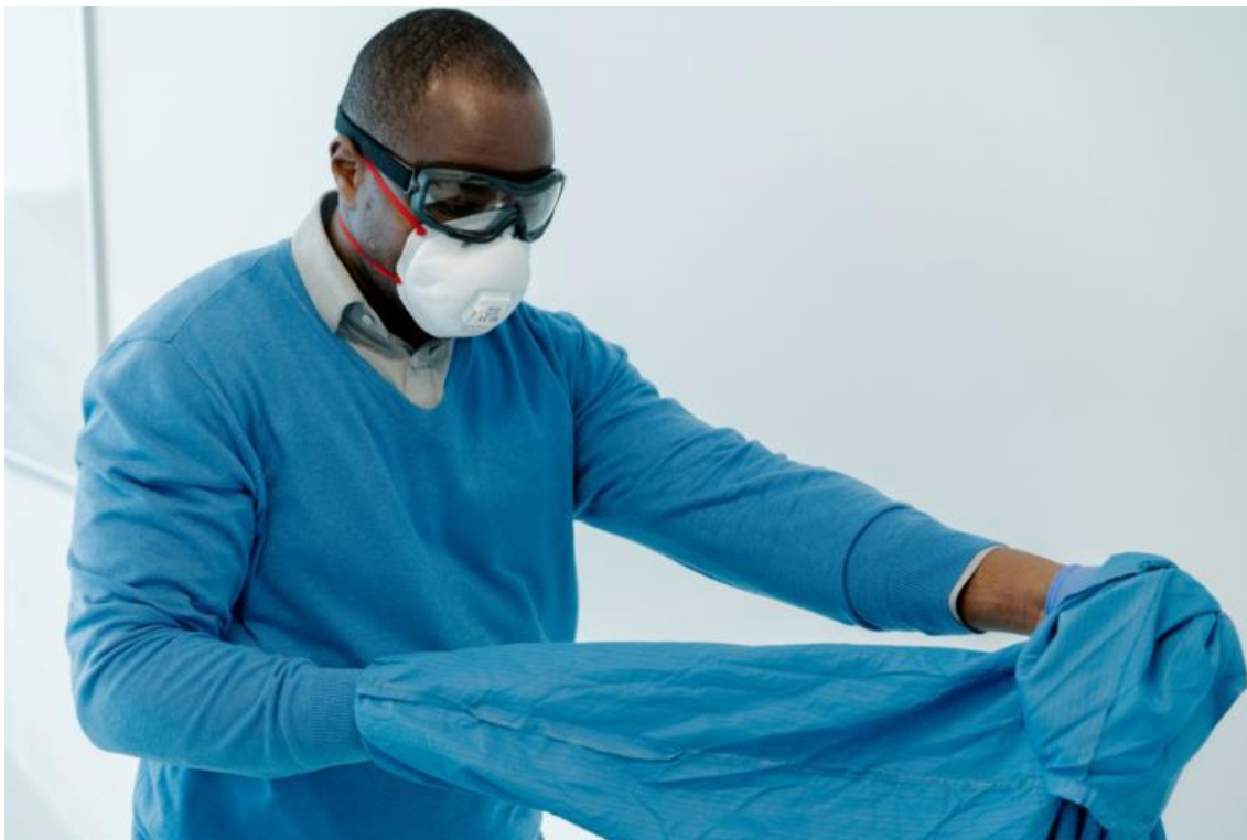
Rycina 17. Ściąganie fartucha – ciągnięcie od siebie.

Fartuchy jednorazowe należy wyrzucić. Fartuchy wielokrotnego użytku powinny zostać przekazane do dezynfekcji. (Rycina 18).