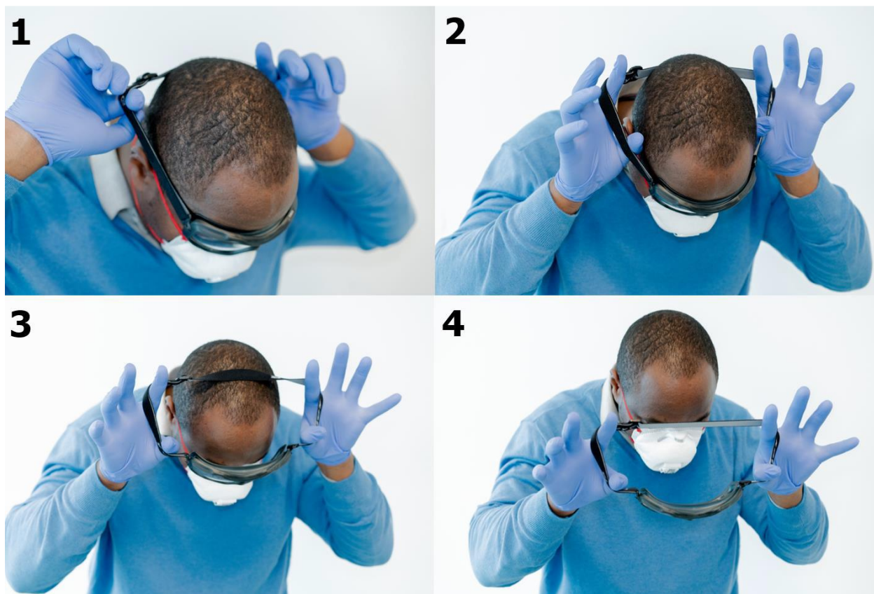
Rycina 19. Zdejmowanie gogli z paskiem elastycznym (kroki od 1 do 4).

Ściąganie gogli z paskiem elastycznym należy rozpocząć od umieszczenia palca pod paskiem a następnie postępować zgodnie z poniższą instrukcją (Rycina 19). Należy unikać kontaktu z przednią częścią gogli, jako potencjalnie skażoną. Procedura zdejmowania gogli z zausznikami została zaprezentowana na Rycinie 20.