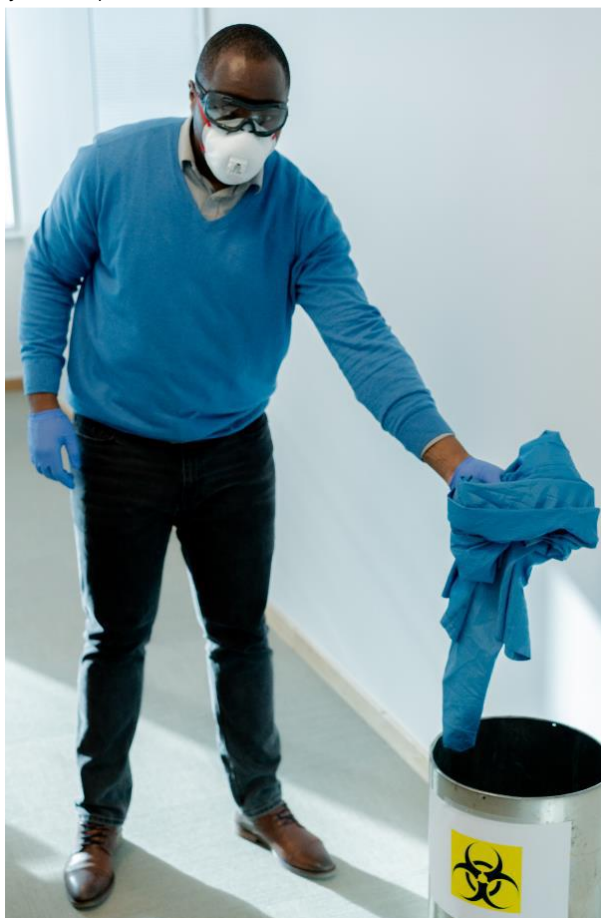
Rycina 18. Umieszczenie fartucha wielorazowego użytku w pojemniku przeznaczonym do dezynfekcji.

Fartuchy jednorazowe należy wyrzucić. Fartuchy wielokrotnego użytku powinny zostać przekazane do dezynfekcji. (Rycina 18).