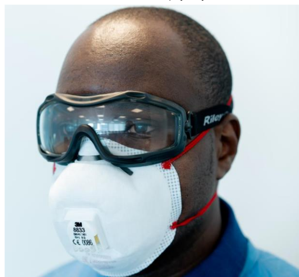
Rycina 11. Gogle ochronne z paskiem elastycznym – widok boczny