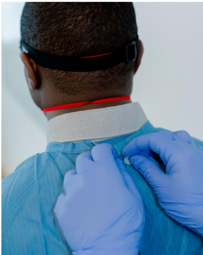
Rycina 15. Rozpinanie fartucha z pomocą asysty

Następnie należy ściągnąć fartuch ochronny łapiąc go z tyłu (Rycina 16) i ciągnąc od siebie wywijając go na lewą stronę, tak by jego skażona część zawinęła się do środka (Rycina 17).