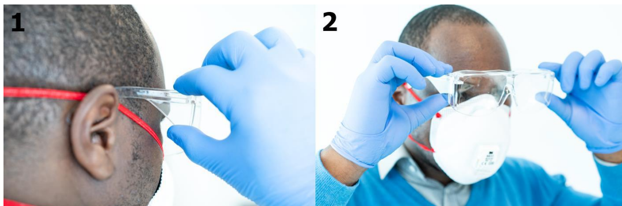
Rycina 20. Zdejmowanie gogli z zausznikami (kroki 1 i 2).

Po goglach należy ściągnąć półmaskę. Jej zdejmowanie należy rozpocząć od umieszczenia kciuka pod paskiem, następnie należy postępować zgodnie z instrukcją umieszczoną na Rycinie 21.