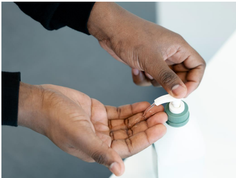
Rycina 3. Dezynfekcja rąk z użyciem środka na bazie alkoholu.

Przed założeniem ŚOI w celu opieki nad pacjentem z podejrzeniem lub potwierdzonym zakażeniem SARS-CoV-2 (COVID-19) należy zastosować procedurę higienicznego mycia rąk i dezynfekcji rąk środkiem na bazie alkoholu, zgodnie z zaleceniami producenta oraz międzynarodowymi wytycznymi [7]. Jest to bardzo ważny etap, którego nie należy pomijać (Rycina 3).