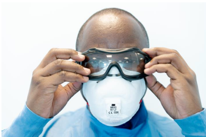
Rycina 10. Zakładanie gogli ochronnych z paskiem elastycznym

Po założeniu i dopasowaniu półmaski/maseczki należy założyć okulary/gogle ochronne lub przyłbice. Należy założyć je na paski półmaski/maseczki i upewnić się, że jest ona stabilnie i komfortowo zamocowana (Ryciny 10 i 11).